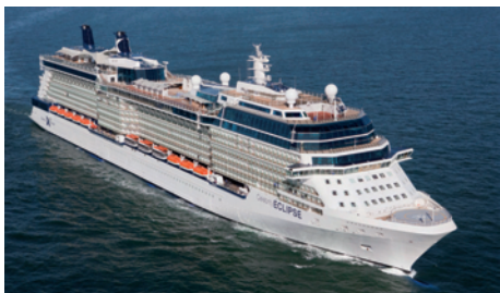
Das Kreuzfahrtschiff Celebrity ECLIPSE, gebaut von der Meyer Werft Papenburg, abgesichert durch Avale von Euler Hermes.