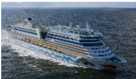
Das Kreuzfahrtschiff AidaBella, gebaut von der Meyer Werft Papenburg, abgesichert durch Avale von Euler Hermes.